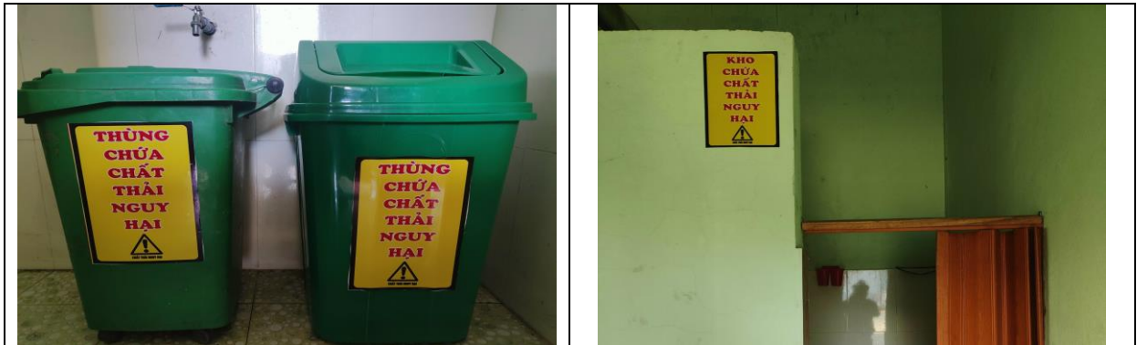
Kho và thùng chứa chất thải nguy hại