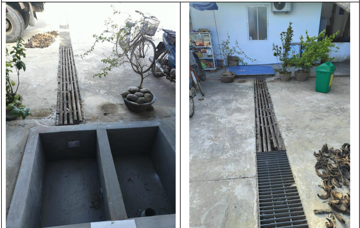
Mương thoát nước và bể tách dầu mỡ